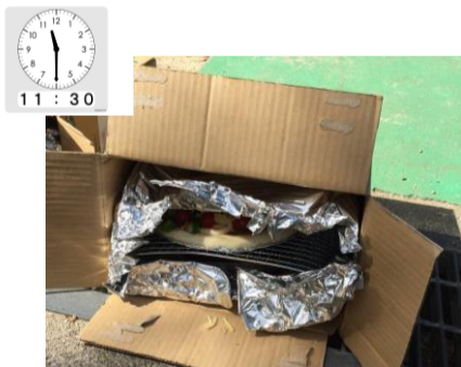
ダンボールかまどにイン