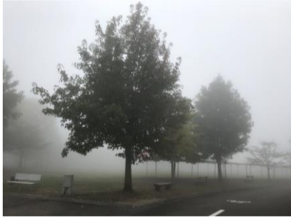
前日準備は雨の中

10月14日(土)松山市野外活動センターにて開催しました。 前日は大雨の中、参加者は集まるのか、とても心配しながら準備を行いました。 そして迎えた当日は、奇跡的に雨が上がり、雨具を持参した約900名の参加者は、それぞれ工夫を凝らしたピザを作り、美味しく楽しく食べました。 お腹がいっぱいになった後は、ニンジャマックスで体を動かし、自己記録に挑戦していました。 今年も大勢の方にご参加いただき、スタッフ一同感謝しております。 また、10周年記念ゲストのレモンさんも、会場を盛り上げていただき、子どもたちの人気者になっていました。