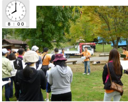
スタッフ集合・打ち合わせ