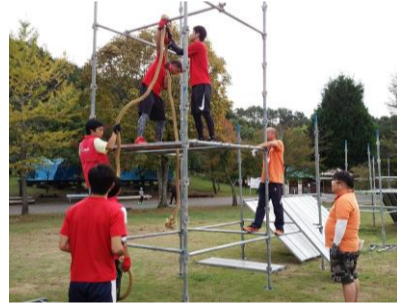
ニンジャマックス準備