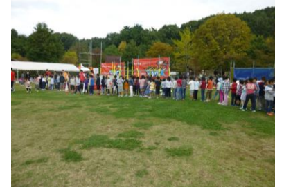
ニンジャマックスに長蛇の列